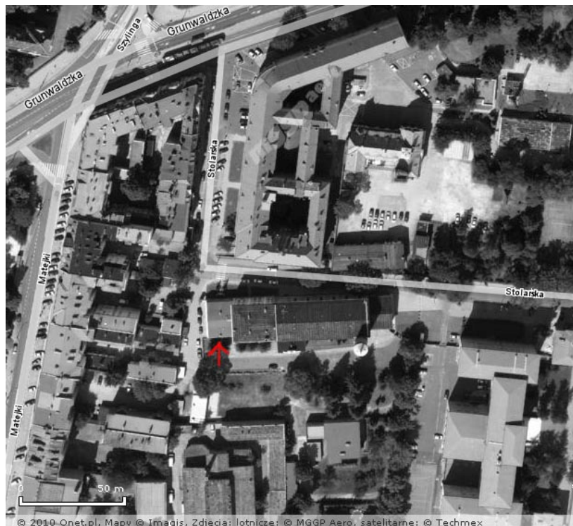
Sala znajduje się w pobliżu centrum, około 10 minut piechotą od dworca PKP.